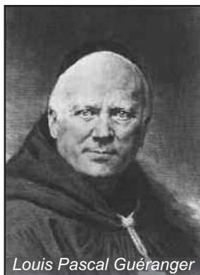
Louis Pascal Guéranger

Obnova crkveno – liturgijsko glazbe u Italiji povezana je uz ime svećenika Lorenza Perosija (1872.-1956.) koji je cecilijanske ideje potpuno usvojio dok je pohađao školu za crkvenu glazbu u Regensburgu. U njoj stiče temeljito glazbeno obrazovanje. Nakon studija vraća se u Italiju i kao vrsni zborovođa i skladatelj daje se na posao. Svojim djelovanjem izvršio je snažan utjecaj na svoje suvremenike, pa čak i na samog papu Pia X. koji ga je imenovao doživotnim zborovođom Sikstinske kapele i bazilike sv. Petra u Rimu. Potaknut idejom cecilijanskog pokreta, papa Pio X. na blagdan sv. Cecilije 22. studenog 1903. god. izdaje « Motu proprio » Tra le sollecitudini (Inter pastoralis officii) o crkvenoj glazbi i osniva Visoku papinsku školu za crkvenu glazbu 1911. god., koja od 1931. god. postaje Papinski institut za crkvenu glazbu. Time se cecilijanska reforma snažno proširila ne samo u Italiji, već i u cijelom katoličkom svijetu.