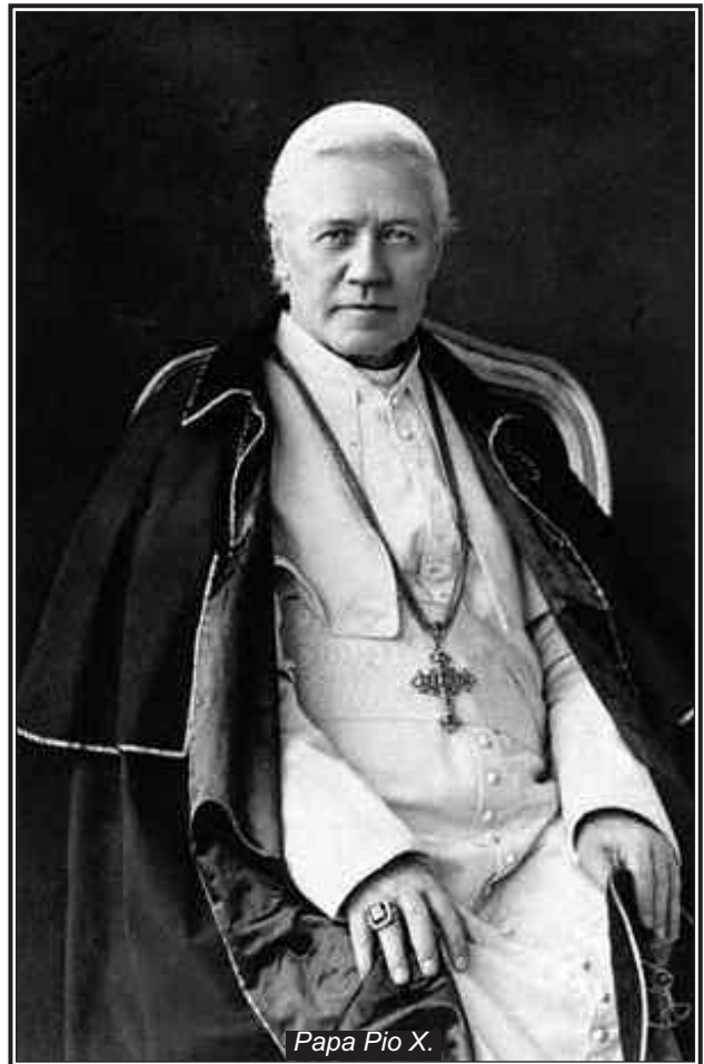
Papa Pio X.

U Francuskoj je posebna pažnja bila posvećena gregorijanskom pjevanju. U tome su najviše poradili benediktinci iz Solesmesa (P. Guéranger, J. Pothier, A. Mocquereau). Nakon novih saznanja po pitanju rekonstrukcije gregorijanskih melodija, benediktinci iz Solesmesa