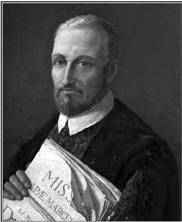
Giovanni Pierluigi da Palestrina