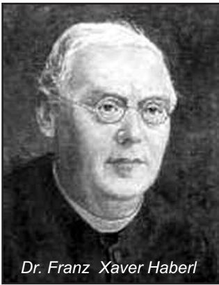
Dr. Franz Xaver Haberl

škola za crkvenu glazbu kojoj je na čelu bio prvi ravnatelj dr. Franz Xaver Haberl (1840.-1910.). Ona postaje idejni centar, rasadnik prave crkvene glazbe za Njemačku i cijelu Europu. U njoj su stjecali znanje studenti iz čitavog svijeta. Pokrenuti su i glazbeni časopisi Musica sacra i Fliegende Blätter für katholische Kirchenmusik (kasnije: Cäcilienvereinsorgan ) 1868.