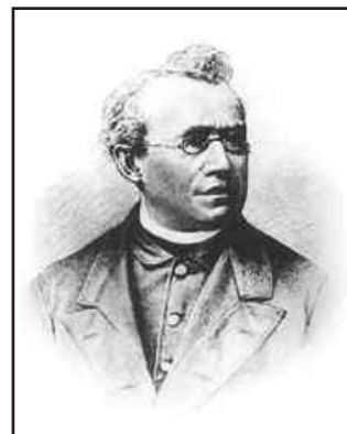
Franz Xaver Witt

osnovao Allgemeiner Cäcilienverein für Länder deutscher Zunge , potvrđen od pape Pia IX. 1870. godine. Glavna zadaća društva bila je njegovanje gregorijanskog pjevanja, klasične polifonije i obnova crkvene popijevke na narodnom jeziku. Također je pažnja bila posvećena glazbi za orgulje, kao i znanstvenom istraživanju crkvene glazbe. U tu svrhu, u Regensburgu je 1874. god. osnovana