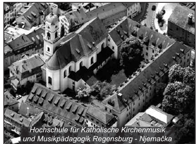
Hochschule für Katholische Kirchenmusik und Musikpädagogik Regensburg - Njemačka