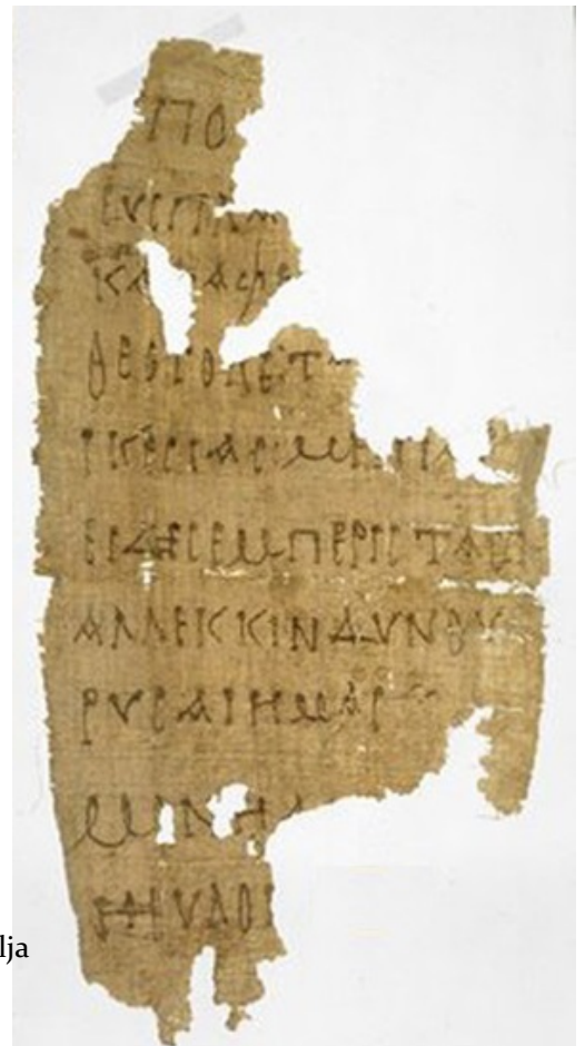
Papyrus iz Aleksandrije, 3. st.

Antifona Pod tvoju se obranu utječemo najstariji je sačuvani tekst u kojem se molitelj obraća Djevici Mariji kao Bogorodici. Pretpostavlja se da je nastala u Koptskoj crvi kao pjesma božićne liturgije u 3. st. Antifona je poznata u svim većim zapadnim i istočnim Crkvama. U Rimokatoličkoj se crkvi pjeva nakon Povečerja u liturgiji časova.